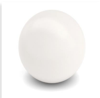
RAL 9010 - Vit

Detaljbild på en Katarina fransk balkong.