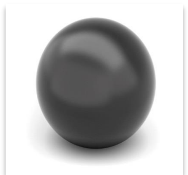
RAL 9005 - Svart

Våra standardfärger är vit, grå, alugrå och svart, men det går naturligtvis bra att få i andra färger också.