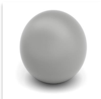
RAL 9007 - Alu Grå