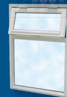
Kombinationsfönster med fast underdel och överhängt fönster. Finns även i andra kombinationer.