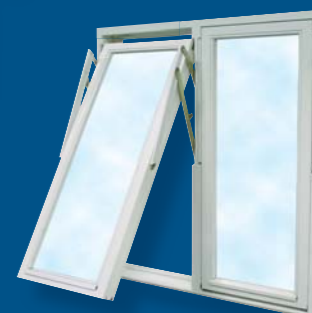
Kombinationsfönster med två bågar i samma karm för större ljusytor.