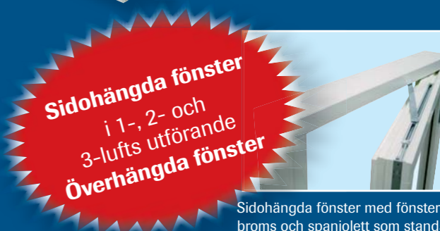
Sidohängda fönster med fönsterbroms och spanjolett som standard.