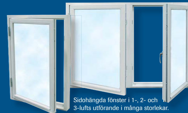
Sidohängda fönster i 1-, 2- och 3-lufts utförande i många storlekar.

Vridfönster med aluminiumbeklädnad med U-värde 0,9 för dig med extra höga krav på dina fönster.